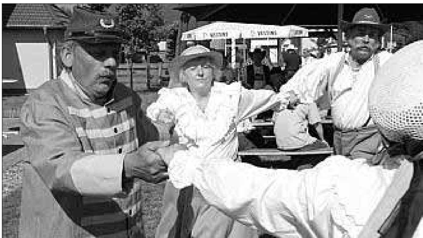
Hamptons-Legion – angeblich aus den Südstaaten, in Wahrheit aus Berlin – sorgte in Rühnick für Stimmung.

PROTZEN ■ Der Ortsbeirat von Protzen kommt heute zur öffentlichen Sitzung zusammen. Diese beginnt um 19 Uhr im Gemeindezentrum.